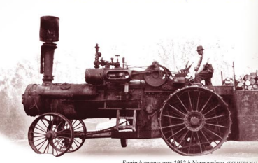
Engin à vapeur vers 1892 à Normandeau. (FSI HERI AS10)